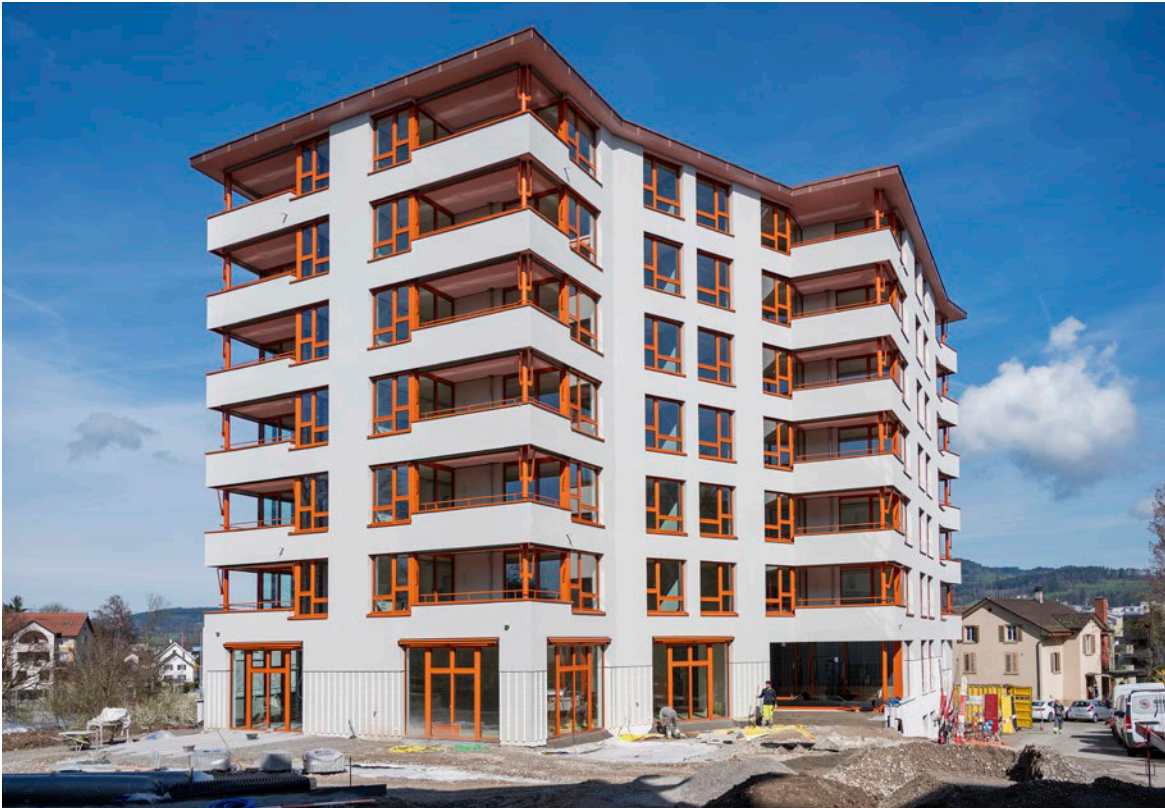
Die ASW hat an der Talstrasse 37 Alterswohnungen gebaut. Die ersten Mieter sind bereits eingezogen.